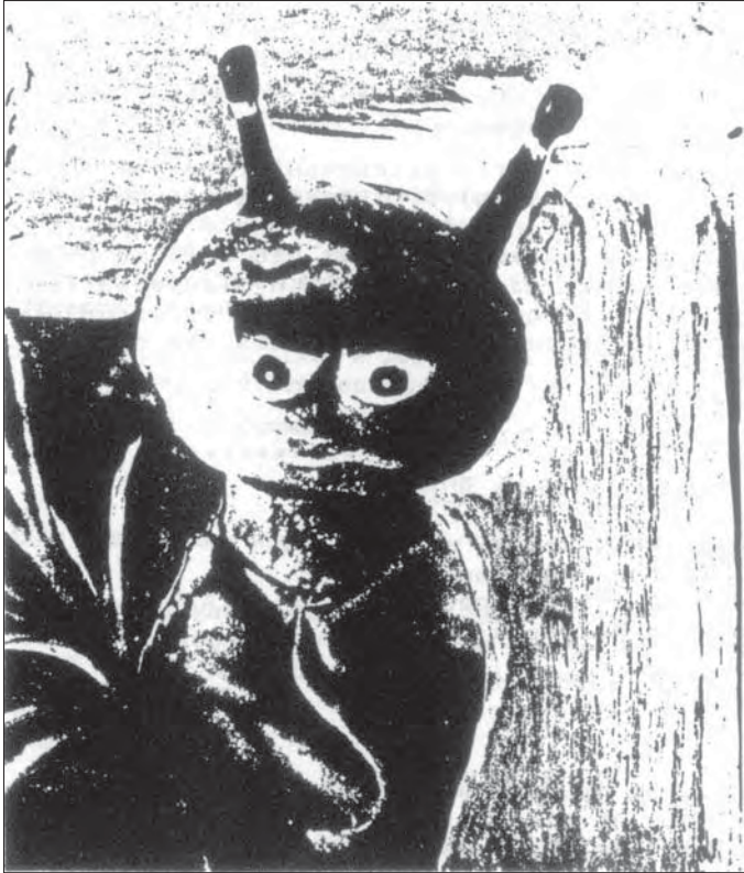
"Iputargia", le petit ver luisant qui raconte des histoires (production du grupo de marionetas Txontxongilo)

Grupo de Marionetas Txontxongilo Paseo Hériz, 16 20008 San Sebastian