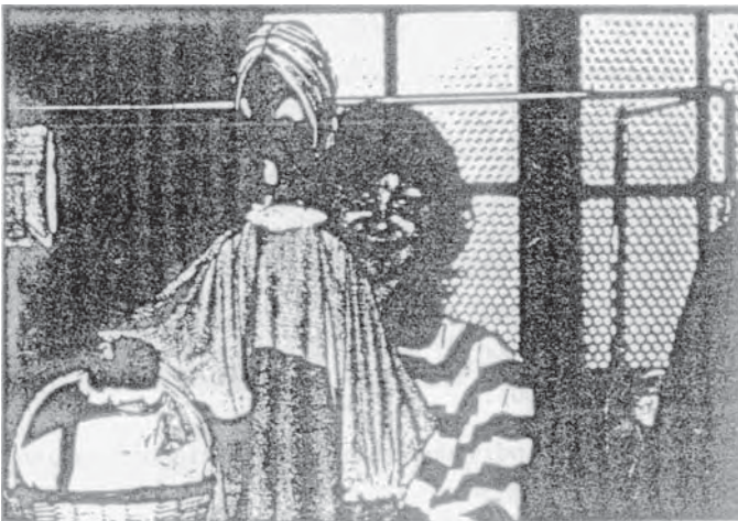
"Armandine TRICOT", la marionnette créée par C. FOUCAULT