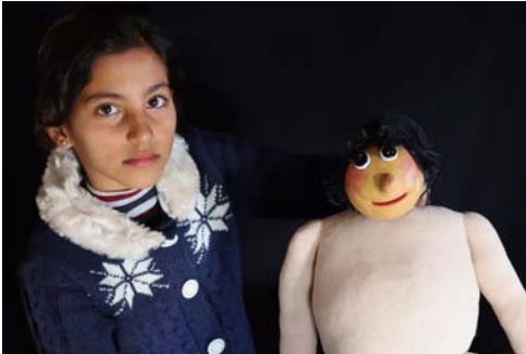
Atelier d'expression avec la marionnette

Le centre d'accueil de l'association est installé dans une zone rurale où les enfants réfugiés syriens sont confrontés quotidiennement au racisme, victimes de nombreux actes de discrimination à l'école mais aussi dans la rue.