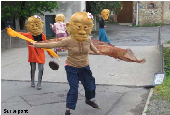
Sur le pont