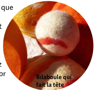
Bilaboule qui fait la tête

Nous avons travaillé chez moi dans la « pièce à vivre » qui est en même temps la cuisine et est assez grande pour que nous puissions laisser ce petit décor sur place en permanence.