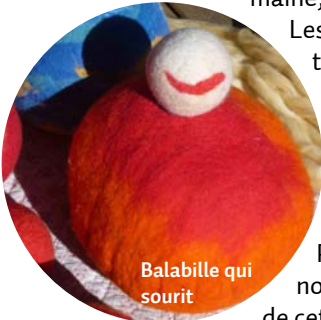
Balabille qui sourit

Dimanche 15, tout était prêt pour cette première cession de travail d'une semaine, le titre provisoire Balabille et bilaboule était trouvé.