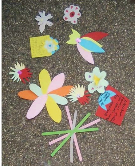
Les fleurs qui séchent dans la cour

La première fois où nous intervenons, c'est le 26 mars, jour de La Grande Lessive® sur le thème de « Fleurir ensemble » (installation artistique de dessins accrochés à des supports divers avec des pinces à linge), et nous y participons ainsi de manière informelle. Les enfants réalisent des fleurs très variées en papier, sur lesquelles ils écrivent un petit mot afin de les offrir à chacune des équipes soignantes avec lesquelles leurs parents travaillent. Nous n'avons pas de pinces à linge pour « étendre » les créations, alors nous installons les fleurs au sol à la manière des grandes buées d'autrefois, lorsque le linge séchait sur l'herbe et sous le soleil, quand la pince à linge n'existait pas.