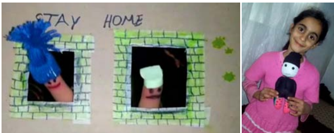
Photos envoyées par une petite fille syrienne pour sa participation au concours de fabrication de marionnettes à partir de matériaux recyclés.

Nous réfléchissons à la création d'un nouveau lieu créatif ouvert au public afin de proposer régulièrement des ateliers de fabrication et des spectacles de marionnettes. L'idée serait de concevoir un espace socio-culturel innovateur, tel un laboratoire créatif où les enfants turcs et syriens pourraient ex-